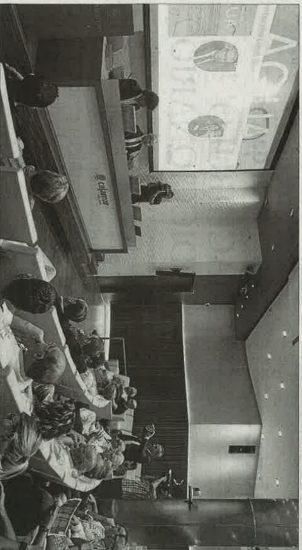
La presentación del Libro Blanco tuvo lugar ayer en Murcia, con el presidente de la CHS de anfitrión. CHS