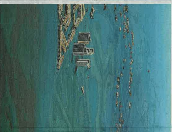
Fotomontaje de La Manga inundada dentro de unas pocas décadas que elaboró Greenpeace para concienciar sobre